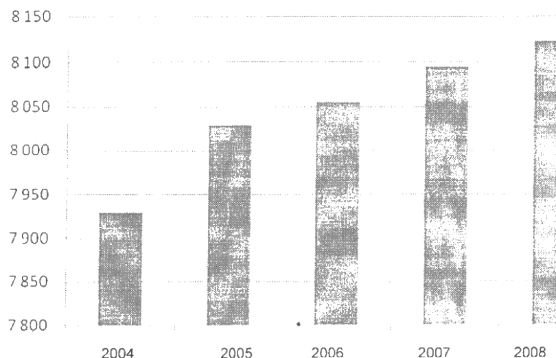
Rysunek 3. Porównawcze zestawienie liczby mieszkańców na gminy terenie Gózd w latach 2004 - 2008

Zasoby mieszkaniowe gminy to w większości mieszkania indywidualne. Ich procentowy udział w ogóle zasobów mieszkaniowych zwiększa się corocznie.